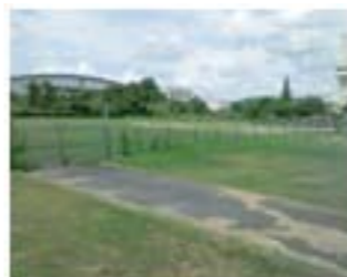
ごみ焼却施設予定地

問 2市3町の大型ごみ焼却施設建設予定地付近の乙川水路で環境基準を超えるダイオキシンが検出され、建設予定が10年延び処理費に約19億円かかる。他の場所を見つけるべきだと思うがどうか。